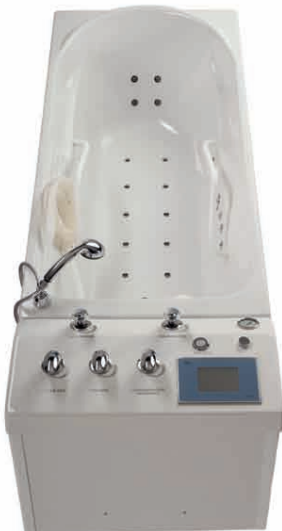
Delta 50 s grafickým dotykovým displejem