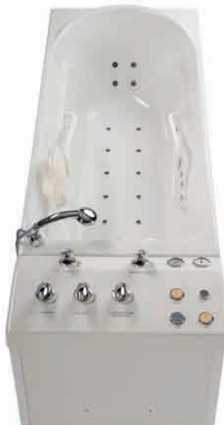
Delta 50 s tlačítkovým ovládním