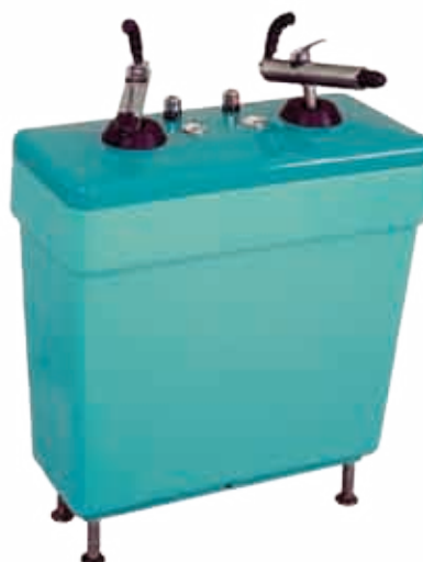
Skotské stříky 10