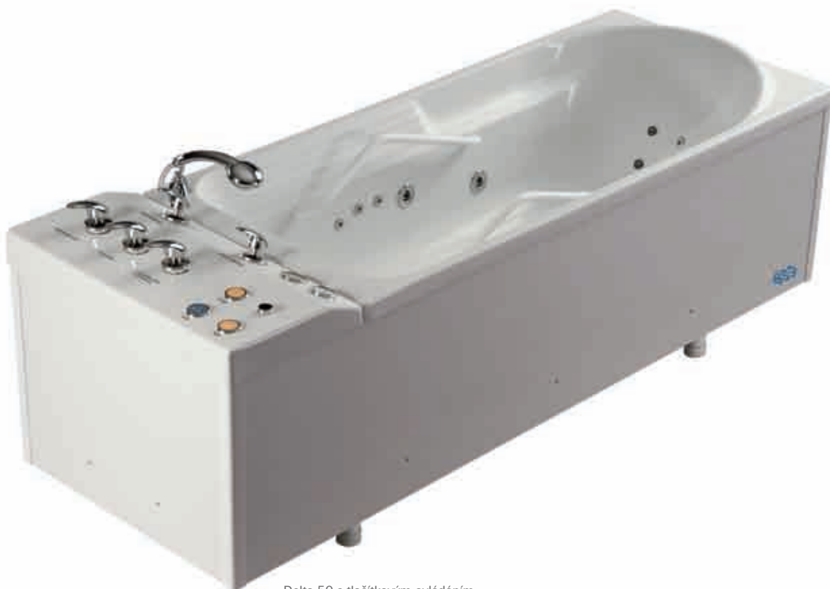
Delta 50 s tlačítkovým ovládním