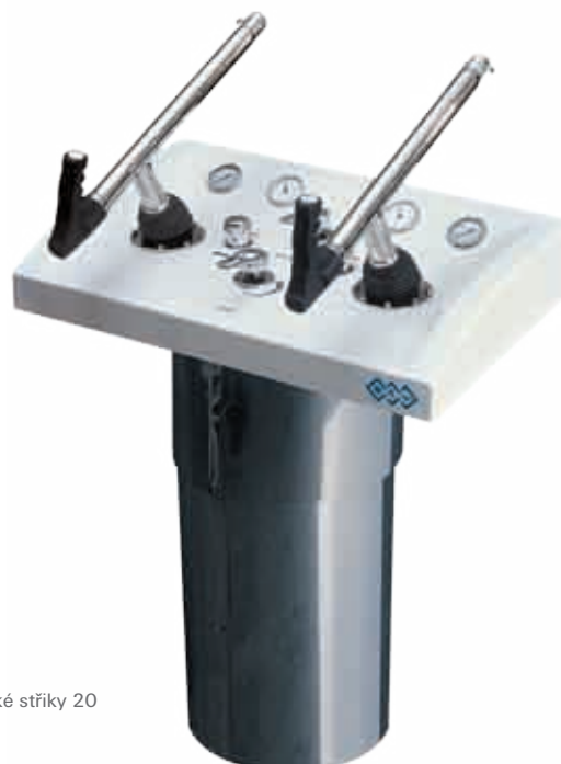
Skotské stříky 20