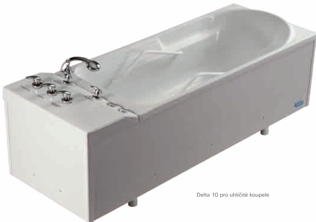
Delta 10 pro uhlíčitě koupele