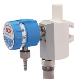
Připojení EU lišta 25x10 NIST + Prodlužovací hadice 1,5m pro O 2 – hadice není součástí dodávky