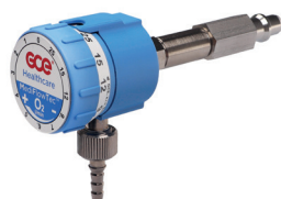
Prodloužená vstupní přípojka (35 mm)