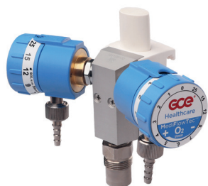
DUO Y - Připojení EU lišta 25x10 NIST + Prodlužovací hadice 1,5m pro O 2 – hadice není součástí dodávky.