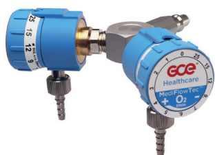
DUO Y vstup rychlospojka