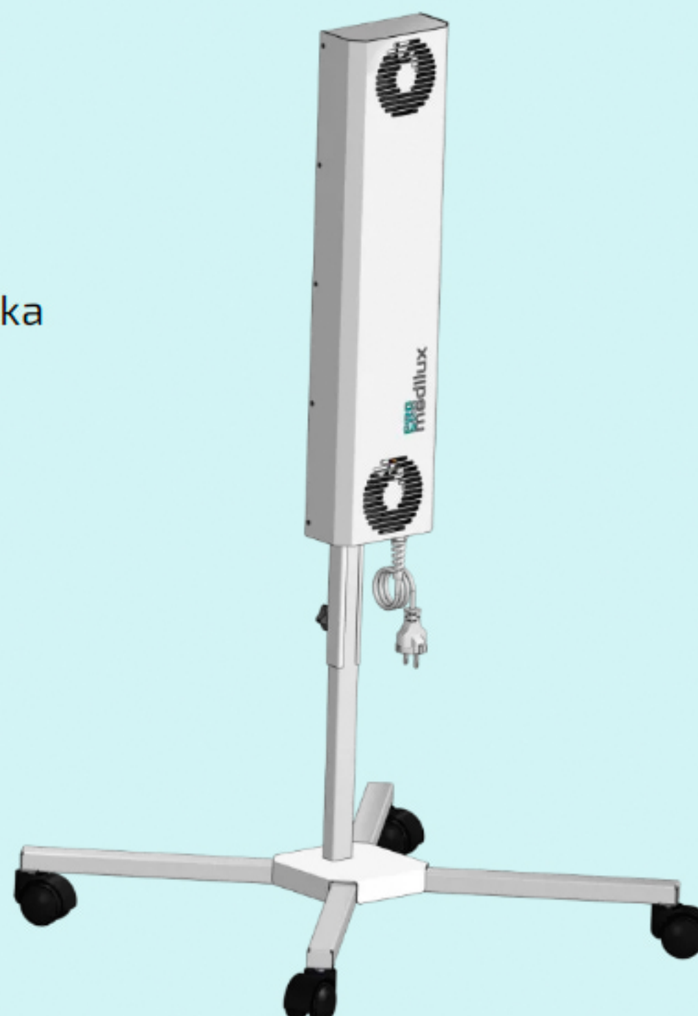
Stojan MPX - KS1 (volitelné příslušenství)