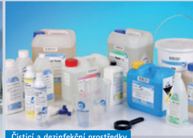
Čističí a dezinfekční prostředky