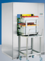
Velké parní sterilizátory 73–1490 l