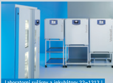
Laboratorní sušárny a inkubátory 22–1212 l