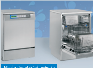
Mycí a dezinfekční technika