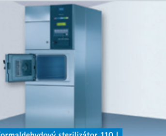
Formaldehýdový sterilizátor 110 l