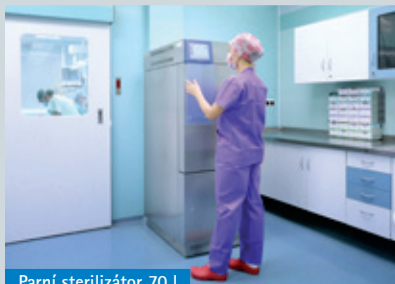
Parní sterilizátor 70 l